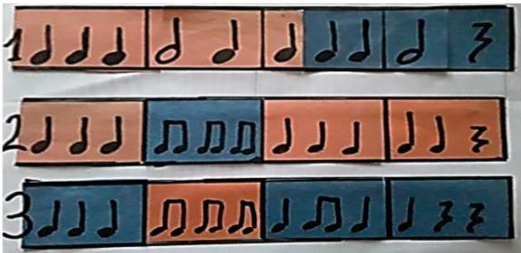
Esquema rítmico fuerte-suave

Toca el siguiente esquema rítmico, tocando fuerte los de color naranja y suave los de color azul. Puedes utilizar palitos, palmadas o un instrumento. Graba un video y envía.